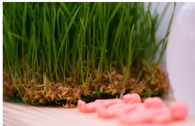
“Cartões postais à Tereza/caixas de entrada”, de Deisiane Barbosa + “Instruções para germinar uma pessoa”, de Lais Guedes