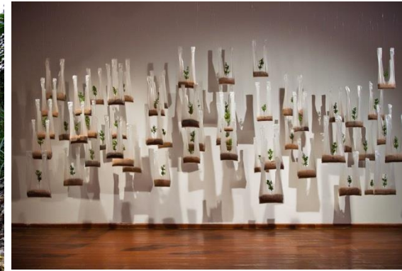
Foto da “Série Lá vem a cidade”, de Alvaro Villela + Foto da série “Cachoeira 1, 2 e 3”, de Clériston Soares + “Des- I Pref.”, de Adriana Araújo