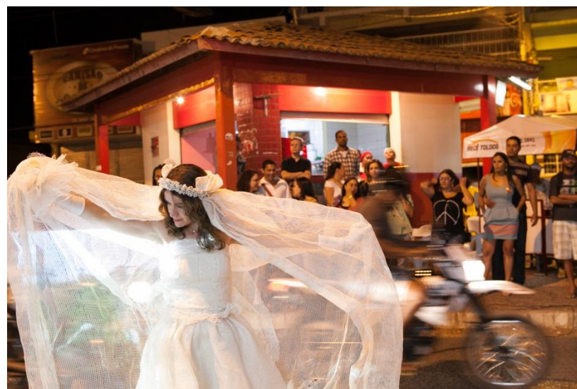
“Proje  es sobre o inacabado”, de Rosa Bunchaft