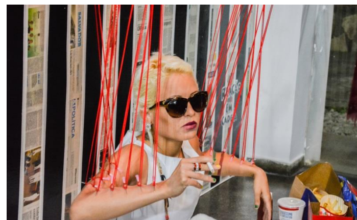
“Reação em Cadeia”, de Roberta Nascimento